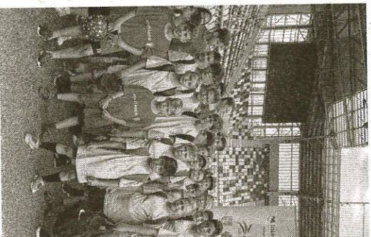
Focitáborosok a DAC-arénában

HATÁRTALANUL A szlovákiai Kürt és Gyermely testvételepítési turisztikai együttműködést szolgáló közös pályázatot nyújtott be a közelmúltban. Az Európai Regionális Fejlesztési Alap és a Kiszprojekt Alap által finanszírozott programban közös kulturális, sport- és gasztronómiai rendezvények és az ezekhez kapcsolódó eszközök beszerzése szerepel. A községek kulturális, szakmai rendezvényein a helyi termelők bemutatnathatják termékeiket, s a konferenciákon pedig megoszthatják a tapasztalataikat is egymással.